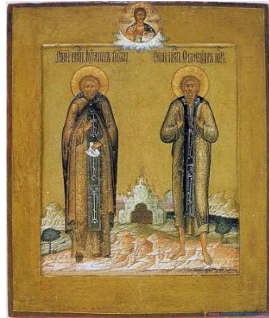
οἱ ἅγιοι Συμεών διά Χριστόν Σαλός καί Ἰωάννης

Ἔπαιζαν λοιπόν μερικοὶ νέοι Λυσόπορτα τρέχοντας ἔξω ἀπὸ τὴν πόλη. Ἐνας ἀπὸ αὐτούς, ἦταν ὁ γιός τοῦ διακόνου Ἰωάννη, φίλου τοῦ Συμεών, πού εἶχε λίγες μέρες πρὶν διαπράξει τὴ σαρκικὴ ἁμαρτία.