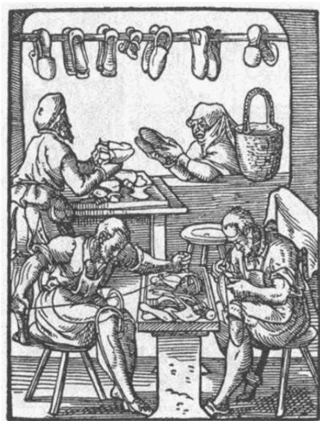
Ύποδηματοποιείο τής εποχής, 1568 ξυλογραφία

Τό άφεντικό του δέν τόν πίστεψε άλλ' ή προφητεία πραγματοποιήθηκε. Όταν σέ λίγες μέρες πήγαν να παραδώσουν τήν παραγγελία στό σπίτι τού έμπόρου βρήκαν ότι είχε πεθάνει και τόν είχαν ήδη θάψει στό κοιμητήρι.